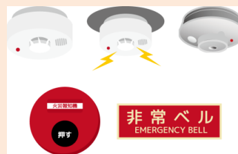
自動火災報知設備