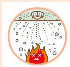
スプリンクラー設備